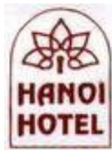
Khách sạn Hanoi Hotel (Liên doanh VN và Hong Kong)