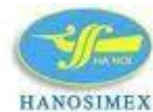
Tổng cty Dệt May Hà nội (Hanosimex)