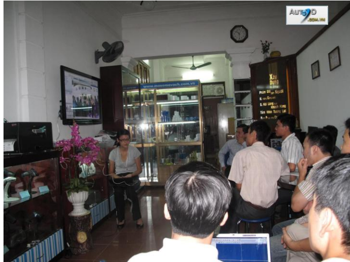
Một buổi đào tạo của Hãng ACTI Đài Loan tại Hà Nội

Đội ngũ kỹ thuật, bảo hành của Digitech thường xuyên được các Hãng sản xuất thiết bị nước ngoài đào tạo nâng cao khả năng nắm bắt các công nghệ mới.