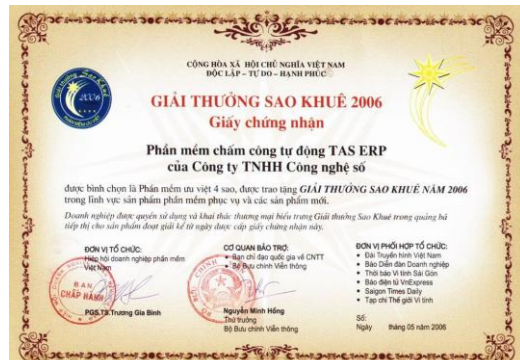
Chứng nhận “Sản phẩm ứng dụng hiệu quả” - Giải SAO KHUÊ 2006

- Trung tâm sửa chữa dịch vụ Autoid chuyên nghiệp đầu tiên tại Việt Nam