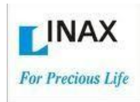
Công ty Sứ Inax VN (Liên doanh VN, Nhật bản)